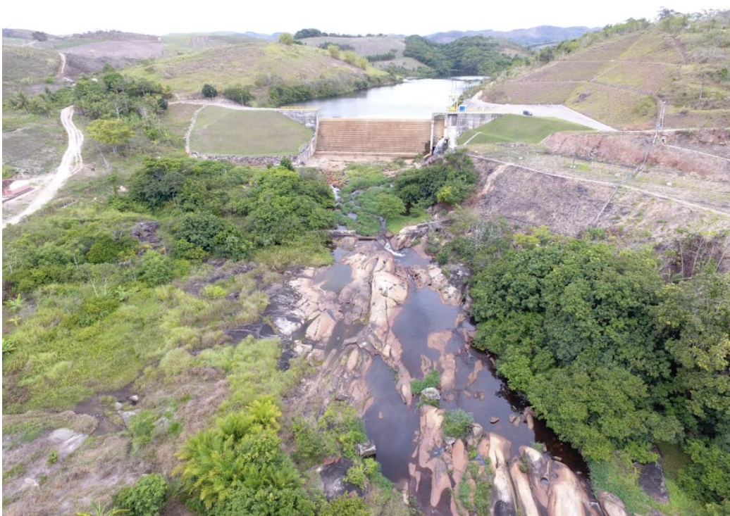
Figura 2 – Vista aérea pelo vale de jusante