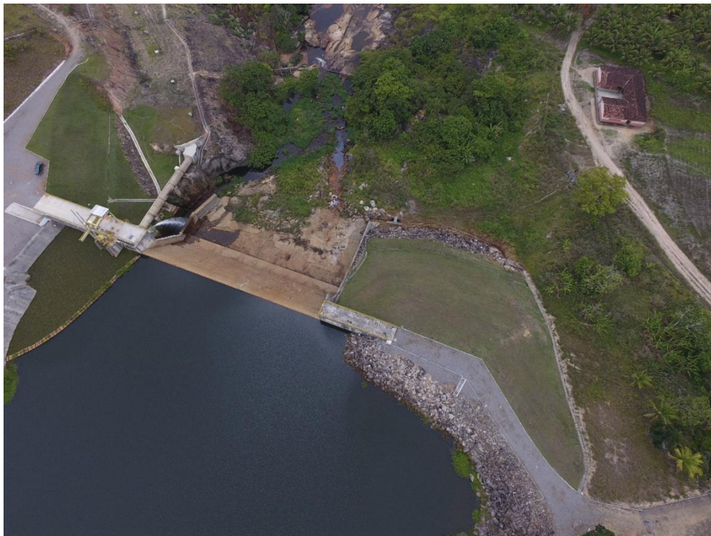
Figura 1 – Vista aérea da unidade