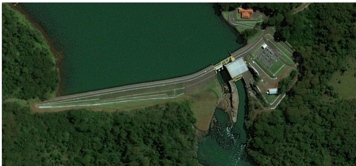
Figura 1 - Localização Geral da PCH – Porto das Pedras